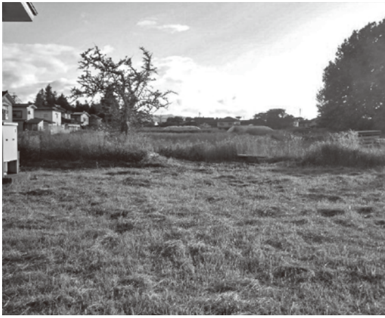
旧朝陽第二小跡地

昨年度から住民からの聞き取りが始まり、今年度は当初 予算に調査費も盛り込まれ、コミュニティ推進課が、関係 者との相談や関係各課と連携を図りながら施設整備基本構 想づくりが進められています。住民の皆様からの要望とし て、子どもも一 緒に運動や交流 ができるコミュ ニティ活動の拠 点としての機能 を中心に、防災 上の避難所とし ての機能も併せ て要望していま す。財源の問題 もありますが、 私は学区住民の 皆様と一緒に なって最大限の 努力をします。