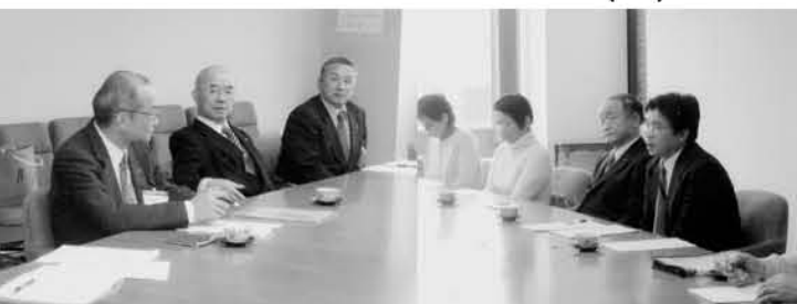
2007.2.2 鶴岡手をつなぐ親の会「要望書」提出

また、「人づくり」こそ鶴岡の未来を築く宝である子育てや青少年育成についてもさらに充実を努めます。そして、なにより、健康は最大の資本です。生活習慣病の予防や介護予防に取り組みとともに、がんについても予防・早期発見の促進、終末期までの一貫したケアの推進を図ります。これらの政策に