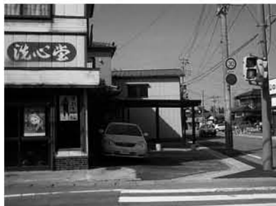
2007.5 陽光町交差点側道整備される