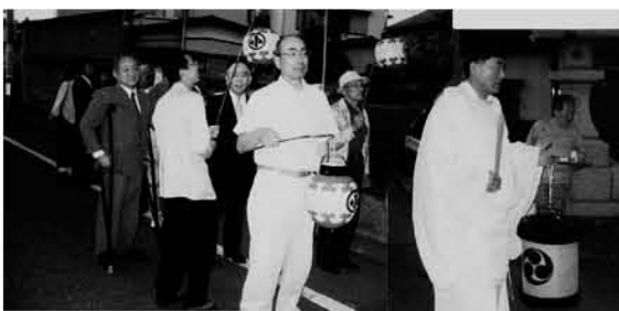
2007.6.3 上山王日枝神社例大祭