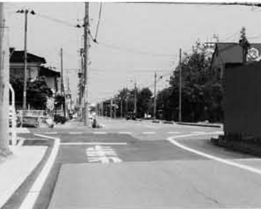
2007.3 旧7号線東新斎町交差点側道整備される